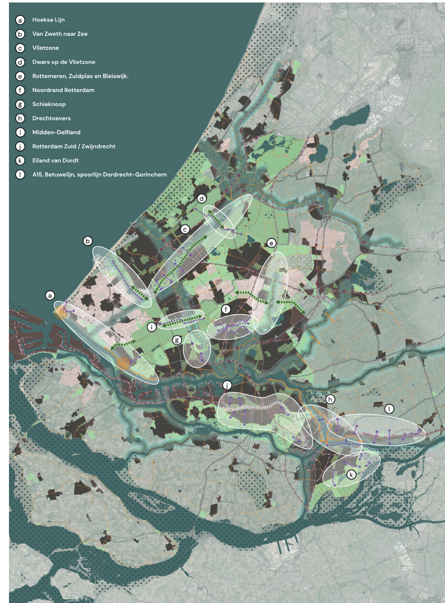
Zones binnen het Landschapspark Zuidvleugel waar met voorrang acties en investeringen nodig zijn