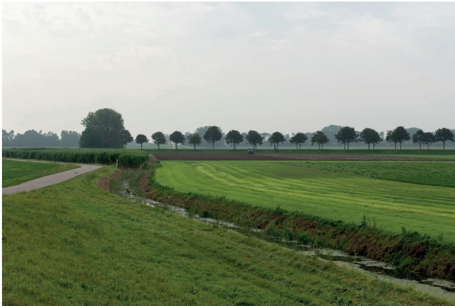
Buijtenland van Rhoon 2023