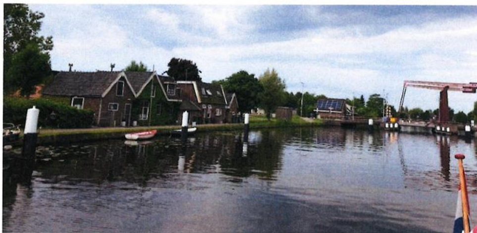
Bestaande wachtplaats voor beroepsvaart aan de Zuidzijde kant, oostelijk van de brug.

De gemeente is benaderd door een aantal aanwonenden van de Oude Rijn te Bodegraven, aan de Noordzijde, oostelijk van de Broekvelderbrug. Wij hebben geluisterd naar hun argumenten en ons ingelezen in het bij besluit van GS PZH juni 2021 uitgesproken voornemen voor realisatie van een combiwachtplaats voor de beroeps- en recreatievaart, noordoostelijk van de Broekvelderbrug, onder opheffing van de bestaande wachtplaats voor de beroepsvaart aan de zuidoostelijke zijde.