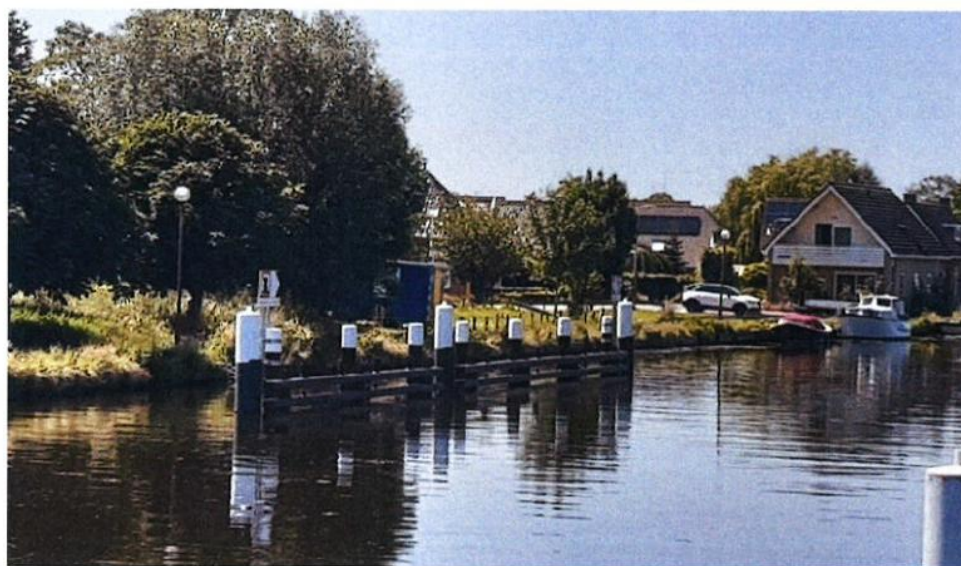
Gerealiseerde combi-wachtplaats aan de Zuidzijde kant, westelijk van de brug.

Uw voornemen is om deze combiwachtplaats te realiseren identiek aan die al aan de westzijde van de brug is gerealiseerd.