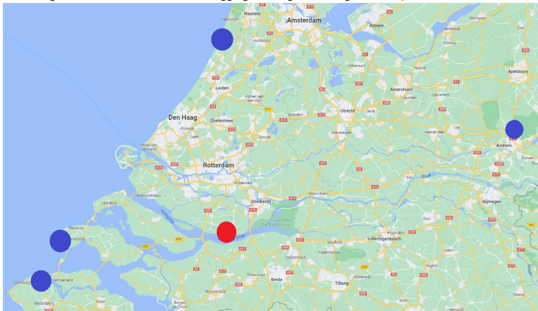
Figuur 1 Indicatieve ligging leefgebieden damherten (blauw) ten opzichte van de Hoeksche Waard (rood)

Zie ook figuur 1 voor een indicatie van de ligging van de genoemde gebieden op kaart.