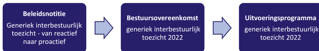
Figuur 1 van beleidsnotitie tot uitvoeringsprogramma

In 2020 is het interbestuurlijk toezicht in Zuid-Holland mede op basis van de input van de gemeenten geëvalueerd. Na de evaluatie organiseerde de provincie ambtelijke sessies en een bestuurlijke bijeenkomst met de gemeenten. De uitkomsten van de evaluatie en de input van de gemeenten zijn verwerkt in de Bestuursovereenkomst en betrokken bij de totstandkoming van dit Uitvoeringsprogramma. De Bestuursovereenkomst vormt de fundering voor het Uitvoeringsprogramma. Dit Uitvoeringsprogramma treedt in werking op 1 januari 2022 en blijft voor onbepaalde tijd van kracht totdat Gedeputeerde Staten hebben besloten tot de wijziging ervan. Het Uitvoeringsprogramma bevat informatie over: