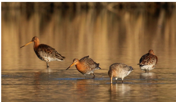
Grutto's zoeken naar voedsel in een plas-drasgebied

Bij de behandeling van de Begroting 2021 is amendement 680 aangenomen. Hiermee is een bedrag van € 1,4 mln beschikbaar gemaakt voor uitvoering van het Actieplan Boerenlandvogels. Hiermee werd voorkomen dat de uitvoering van het Actieplan vertraging zou oplopen. In februari en maart is de Subsidieregeling groen opengesteld voor investeringen gericht op boerenlandvogels. Ook wordt een deel van het geld besteed aan een betere ondersteuning van de vrijwillige weidevogelbeschermers door De Groene Motor en wordt de capaciteit voor uitvoering van het Actieplan bij de provincie uitgebreid. Voor het beheren van de reeds gerealiseerde gebieden is hiernaast voor 2021 € 1,5 mln toegevoegd middels de voorjaarsnota.