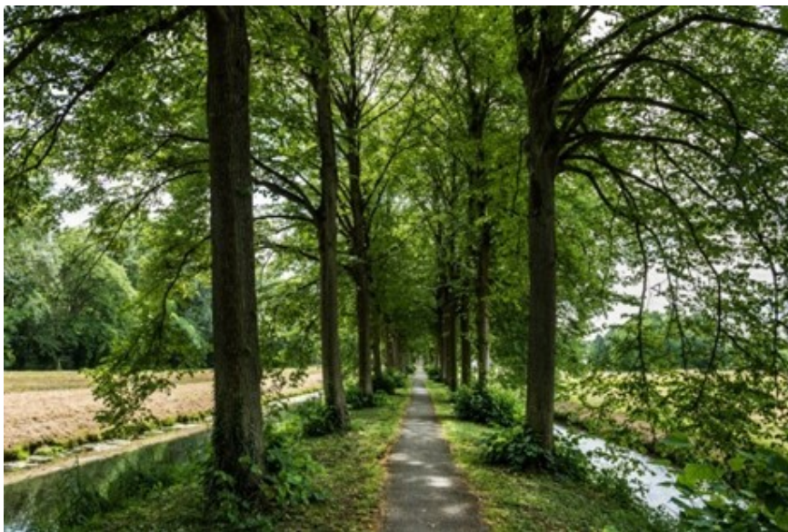
Bomenlaantje bij Rhoon

In het groeimodel is afgesproken om uitbreiding van bos en bomen te koppelen aan provinciale opgaven en als ambitie mee te nemen bij lopende gebiedsprocessen en programma's. Met acties vanuit bos- en bomenbeleid willen we deze opgaven en programma's daarbij ondersteunen en ook actief kansen in beeld brengen en verzilveren.