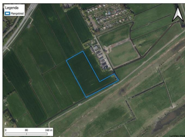
Figuur 1: Het plangebied (blauw kader) waarin de natuurcompensatie wordt gerealiseerd.