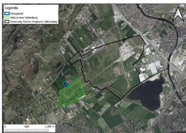
Figuur 2: Ligging van het plangebied (blauw kader) ten opzichte van de Natuurzone en het voormalig marine vliegveld Valkenburg.

De benodigde compensatie van NNN (kruiden- en faunairijk grasland), bekostigd door het museum, is beoogd aan de Ruigelaan te Wassenaar op gronden van de gemeente en voldoet ruimschoots aan het NNN(-compensatie)beleid van de provincie. Zie hieronder de compensatielocatie in beeld (blauwe kaders).