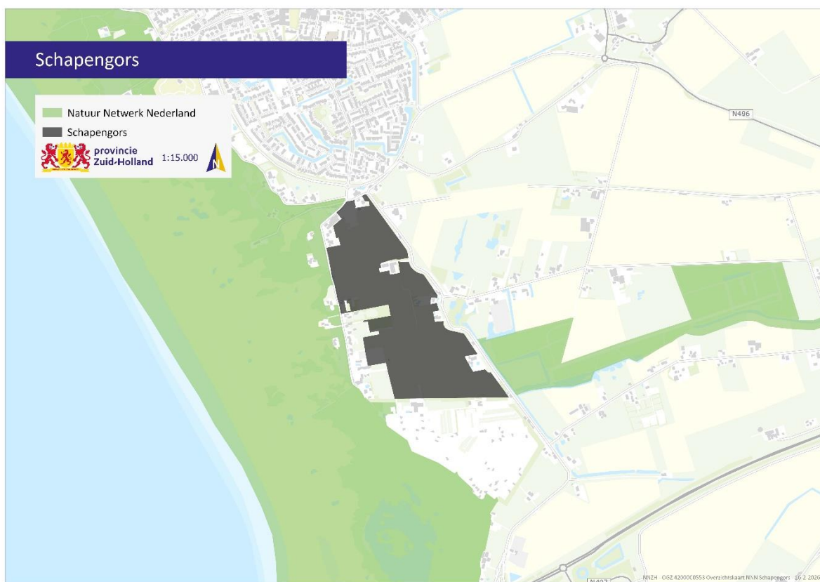
Afbeelding 1. NNN-gebied Schapengors

Het gebied Schapengors (zie afbeelding 1) op Voorne-Putten bij Rockanje in de gemeente Voorne aan Zee is één van de gebieden waar natuur aangelegd moet worden voor het Natuurnetwerk Nederland (NNN). In het Natuurpact (2013) hebben Rijk en provincies afgesproken dat de provincies verantwoordelijk zijn voor het realiseren van een kwalitatief goed, aaneengesloten netwerk van natuurgebieden en ecologische verbindingen die in duurzaam beheer zijn bij de eindbeheerders. Ook is afgesproken dat de provincies de inrichting van het NNN eind 2027 voltooien. De afspraak dat het in 2027 voltooid moet zijn, is bekrachtigd in het coalitieakkoord 'Krachtig Zuid-Holland' .