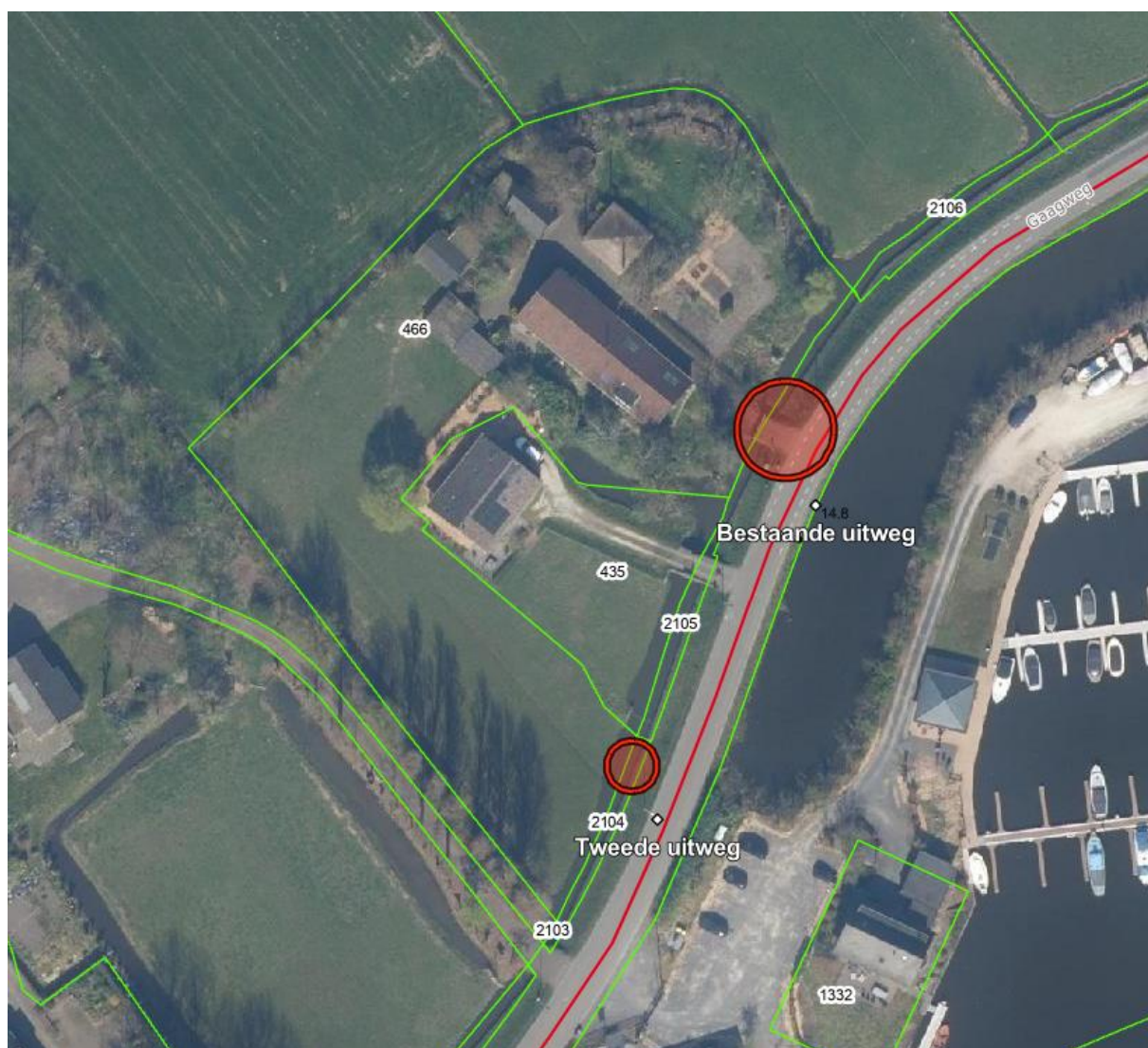
Afbeelding 2: huidige situatie; de groene lijn geeft de perceelgrens aan. De grote cirkel geeft de bestaande uitweg aan. De kleine cirkel geeft de locatie aan voor de tweede uitweg.