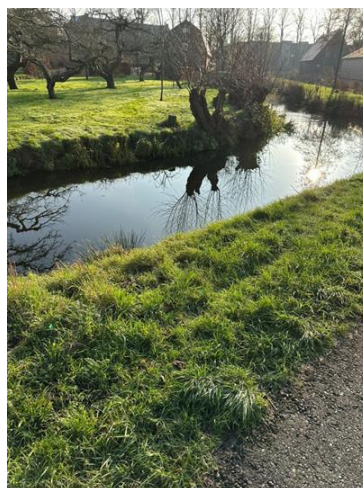
Sloten rondom het perceel van betrokkene