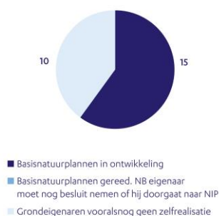
Grondeigenaren en zelfrealisatie februari 2025