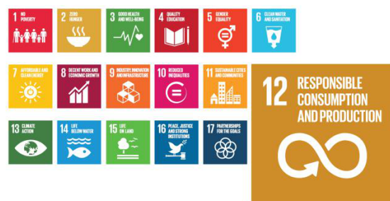
Afbeelding 1: Sustainable Development Goals

Tegen deze achtergrond is Provincie Zuid-Holland op zoek naar de kansen en mogelijkheden om voedselverspilling tegen te gaan. In dit document beschrijven we deze kansen en mogelijkheden.