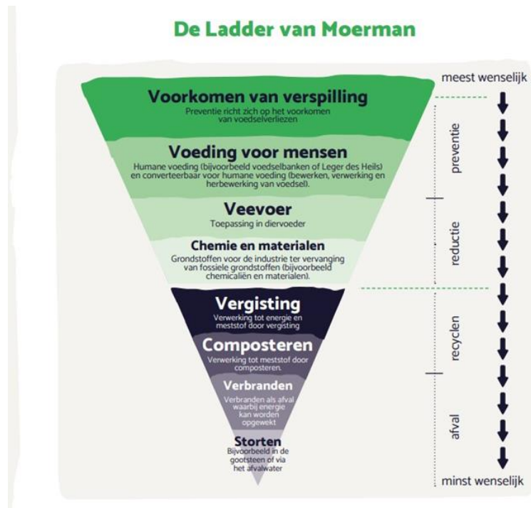
Afbeelding 3: Ladder van Moerman

verspilling. Als een stroom voorheen werd gecomposteerd en nu wordt ingezet als veevoer, is dit volgens deze definitie van Moerman een verbetering.