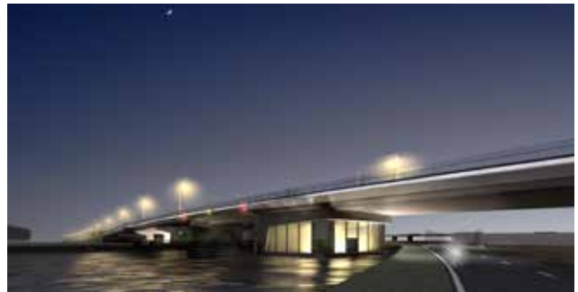
Planning werkzaamheden Extra Gouwekruising

Provincie Zuid-Holland parallelA12@pzh.nl