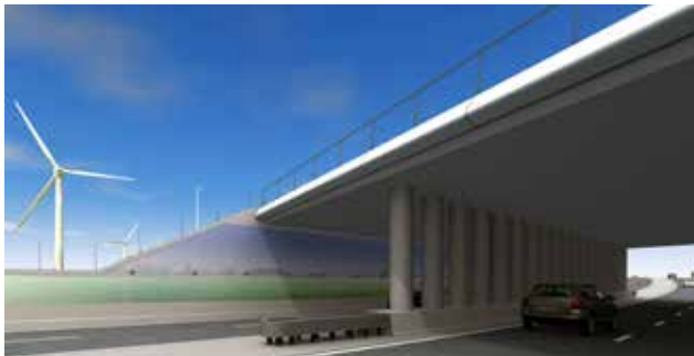
Planning werkzaamheden Moordrechtboog

In 2014 en 2015 zijn de volgende werkzaamheden uitgevoerd: het kappen van bomen, verleggen van kabels en (water)leidingen en de aanleg en verlegging van fietspaden.