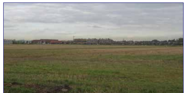
Zicht op de stadsrand van Barendrecht.