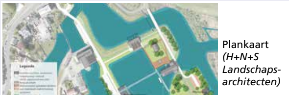
Plankaart (H+N+S Landschaps- architecten)