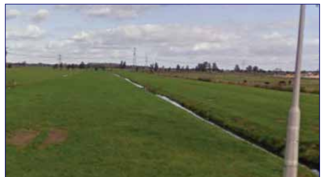
Uitzicht vanaf Kortland in noordelijke richting, kade begrenst het gebied.