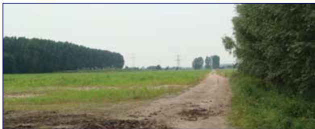
Zicht op het zoekgebied vanuit boerderijlint in westelijke richting.