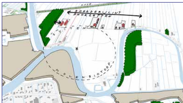
Ontwerpkeuzes: positionering van gebouwen in verlengde van boerderijlint, buiten de molenbiotoop.