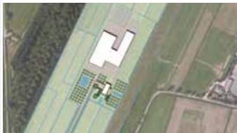
Plankaart (Bosch Slabbers Landschaps- architecten)