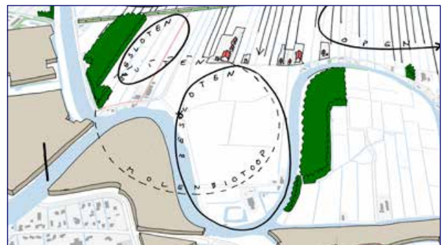
Kenmerken: relatief besloten deel Alblasserwaard door grote bospercelen, verspringende lintbebouwing, huidige bebouwing in molenbiotop.