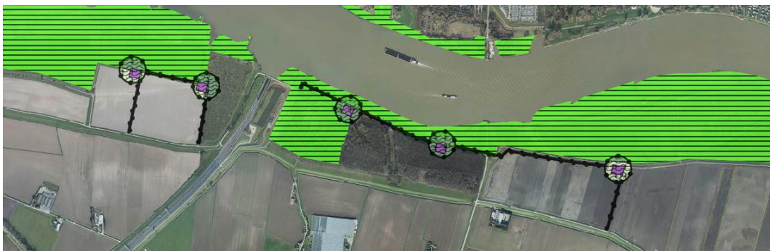
Afbeelding 1 - Ligging plangebied bestemmingsplan Windpark Oude Maas ten opzichte van NNN (groene arcering)