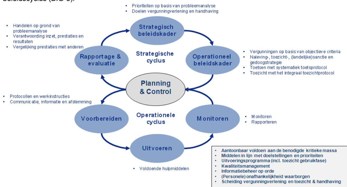
Figuur 2: de gesloten beleids- en uitvoeringscyclus conform de BIG 8

De provincie verwacht van de werkprocessen dat de uitvoerende organisatie werkt volgens de gesloten beleidscyclus (BIG-8).