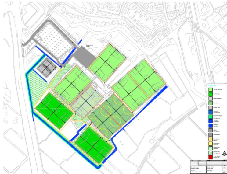
Definitieve indeling sportpark en inpassing