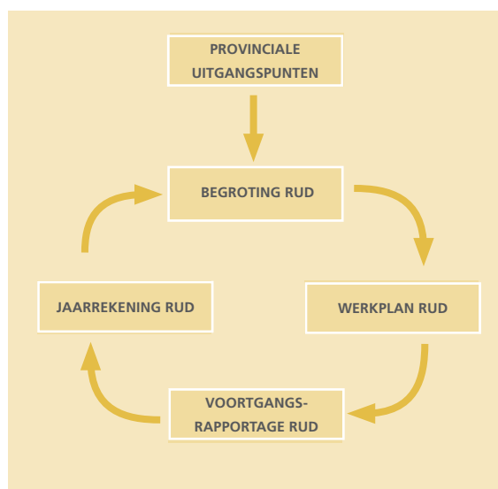
Figuur 3: Planning en control cyclus jaarprogramma omgevingsdiensten

Een belangrijk element in de BIG-8 is planning en control. Hierin maken provincie en omgevingsdienst afspraken met elkaar over de jaarlijks uit te voeren taken. Daarbij zijn de kaders van de provincie leidend. Het onderstaande figuur schetst de jaarlijkse planning en control cyclus. Het werkplan van de omgevingsdiensten voldoet aan de provinciale uitgangspunten en past binnen de begroting. Na vaststelling voert de omgevingsdienst het werkplan uit, waarbij de provincie voortgangsrapportages ontvangt. Wanneer nodig kan de provincie bijsturen.