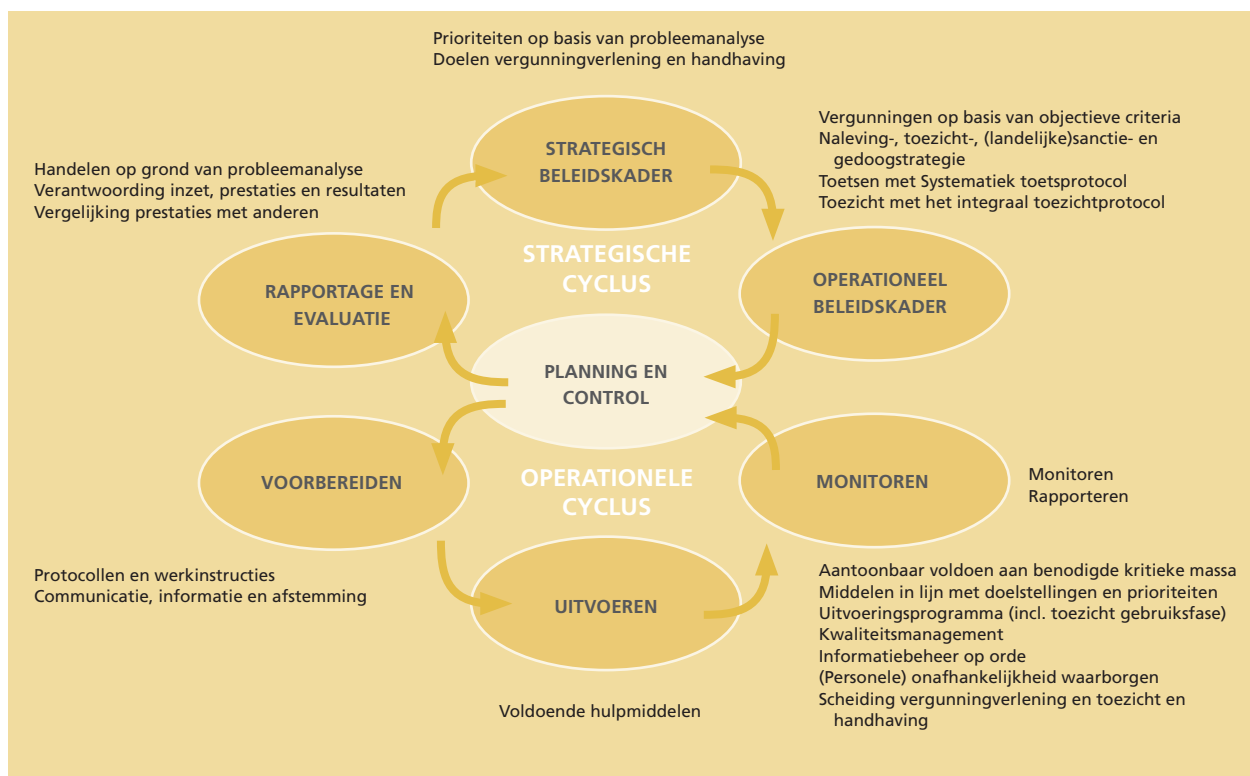
Figuur 2: De gesloten beleids- en uitvoeringscyclus conform de BIG 8

diensten en geven aan waar omgevingsdiensten minimaal aan moeten voldoen voor het uitvoeren van de (provinciale) VTH-taken. Deze eisen gelden ook voor deskundigheid en beschikbaarheid van medewerkers bij de vergunningverlening, het toezicht en de handhaving. Hierbij gaat het om het vereiste opleidings- en ervaringsniveau van medewerkers en om de minimaal vereiste beschikbaarheid van ervaren deskundigen. Medewerkers die belast zijn met vergunningverlening, toezicht of handhaving, kunnen hun taak alleen adequaat vervullen als zij over voldoende deskundigheid beschikken. Deze deskundigheid is gebaseerd op zowel opleiding als ervaring. Een opleidingsplan dat de omgevingsdienst opstelt, moet de kwaliteit van de medewerkers borgen. Daarnaast is essentieel dat gewaarborgd is dat medewerkers in voldoende mate inzetbaar zijn.