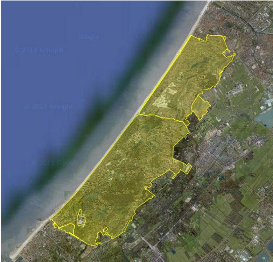
Figuur 1.1. Ligging van het Natura 2000-gebied Meijendel-Berkbeide met de deelgebieden Meijendel (zuidelijk) en Berkbeide (noordelijk) in het kustgebied tussen Den Haag en Katwijk.