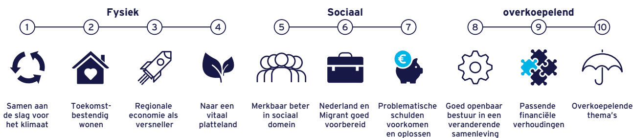
De tien opgaven uit het Interbestuurlijk Programma