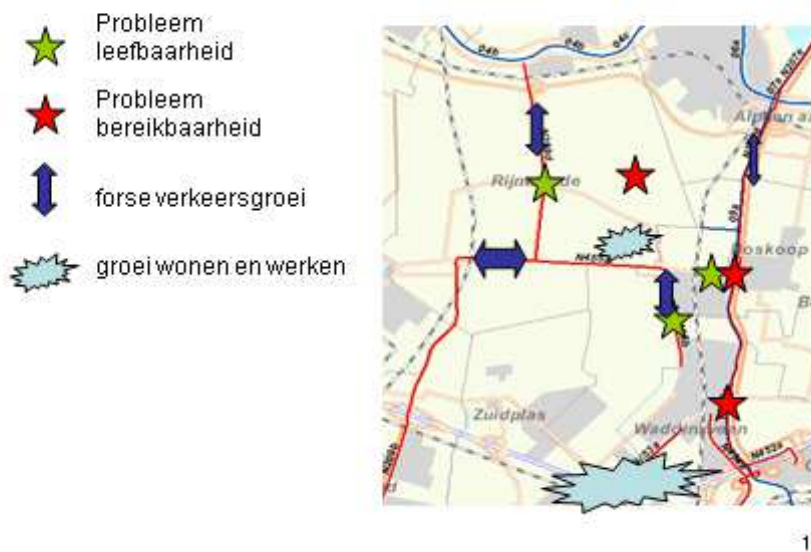
Figuur 1: situatie van locaties met problemen t.a.v. leefbaarheid en bereikbaarheid en ontwikkellocaties.

De doorstroming van het verkeer op de N207 en de N209 (vanaf Bleiswijk/Kruisweg) vormt een knelpunt. Opgemerkt wordt daarbij dat de regionale hoofdverbinding N207 aan de oostzijde van de Gouwe ligt, terwijl de kernen en het zwaartepunt van de Greenport Boskoop aan de westzijde liggen. Dit geeft een zware belasting op de oost-west verbindingen die via de twee hefbruggen de Gouwe kruisen.