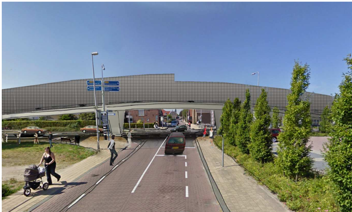
Figuur 3: Impressie / visualisatie viaduct met geluidsschermen

Langs de N209 inclusief het viaduct moeten geluidsschermen worden aangebracht om de geluidhinder te beperken.