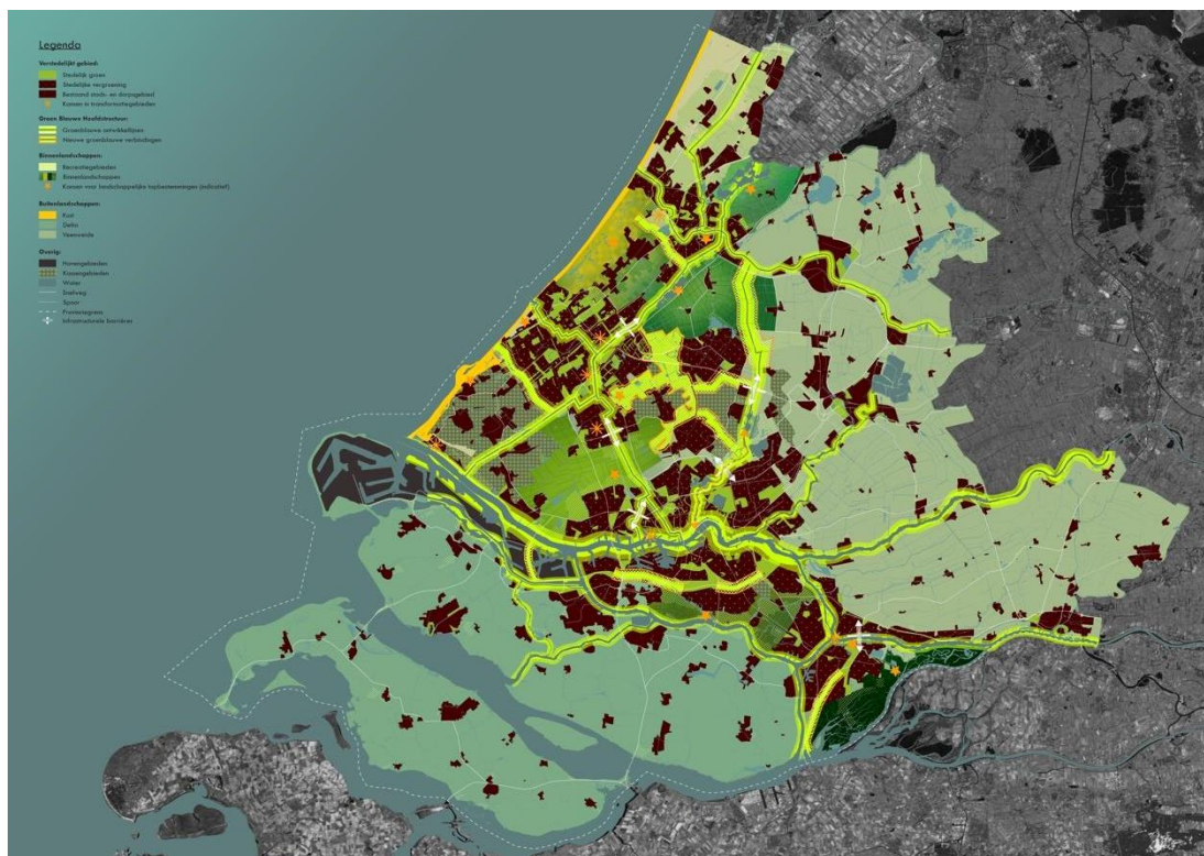
Visiekaart Landschapspark Zuidvleugel

Met deze dubbeldoelstelling ontstaan verschillende meekoppelkansen voor het provinciaal beleid. Het versterken van het landschap in, om en tussen onze steden maakt de regio klimaatbestendiger, draagt bij aan biodiversiteit, versterkt de potentie voor waterrecreatie, draagt bij aan de erfgoedlijnen langs vaarten en rivieren, en versterkt de leefomgeving en ruimtelijke kwaliteit voor onze inwoners.