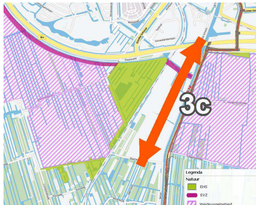
Figuur 2 In groene gebied doen bedrijven legselbeheer