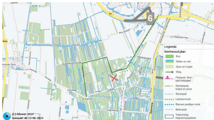
Figuur 1 Aansluiting op 3c (groene lijn)