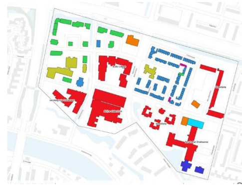
Het gebied, uitgebreide kaart staat bij 'scope'