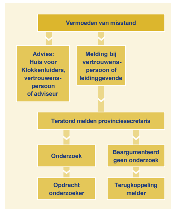
Vermoeden van een misstand.

In het geval van misstanden wordt officieel melding gemaakt bij een leidinggevende of vertrouwenspersoon. 3 Bij zware misstanden wordt de 'Regeling Melden Vermoedens van een Misstand' in werking gezet (zie het stroomschema). Deze regeling vloeit voort uit de 'Wet Huis voor Klokkenuiders' die in 2016 in werking trad en o.a. ten doel had klokkenluiders extra rechtsbescherming te bieden (Nota "Integriteit is van ons allemaal", 2020).