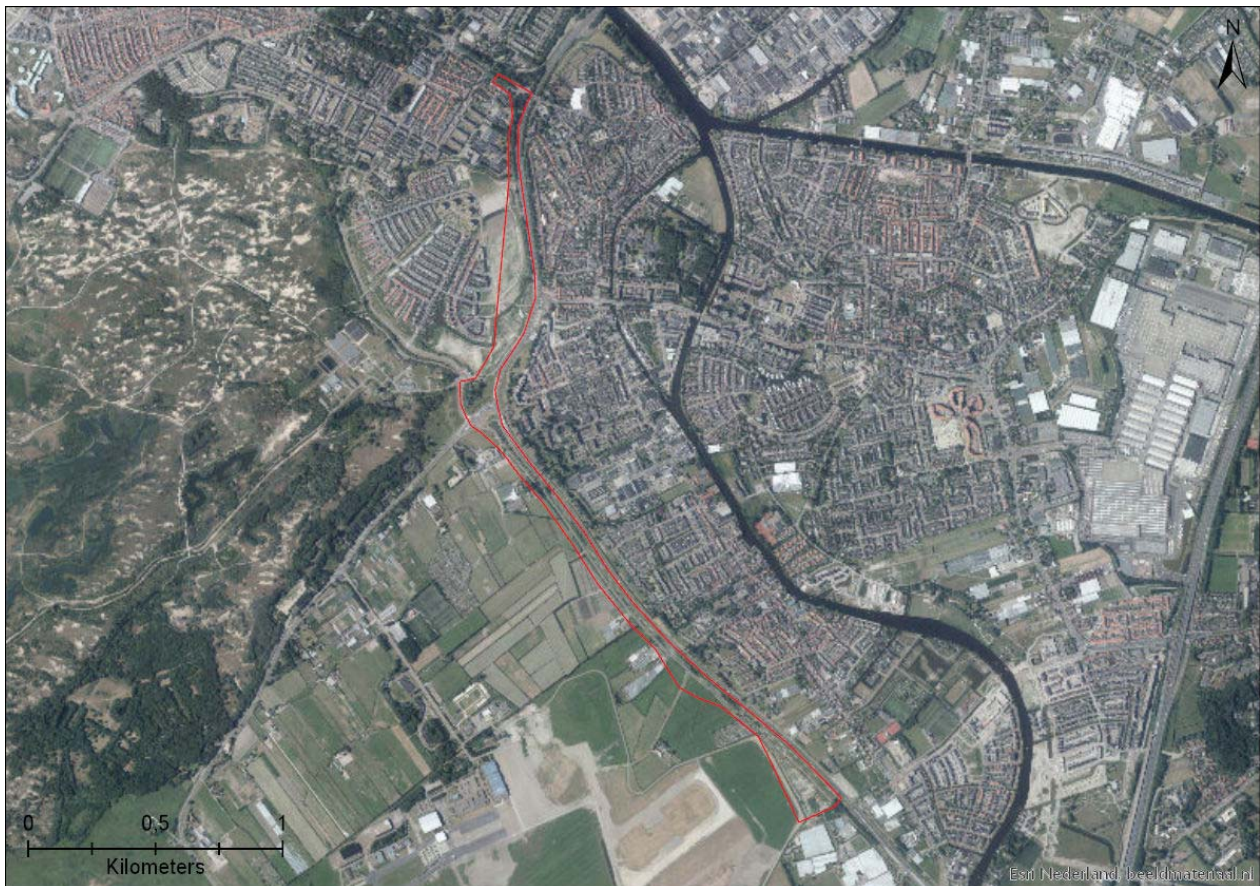
Figuur 3-1. Ligging van het plangebied aangegeven met rode lijn.

De provincie Zuid-Holland is voornemens een busbaan aan te leggen naast de N206 tussen Leiden en Katwijk (Figuur 3-1). In het westen van de weg is vooral bebouwing. In het oosten van de weg ligt vooral agrarisch landschap. Ook Natura 2000-gebied Meijndel & Berkheide ligt oostelijk van de N206. Het plangebied bestaat met name uit agrarisch grasland. Ook bevinden zich er verscheidene watergangen. Figuur 3-2 Figuur 3-8 geven een impressie weer van het plangebied.