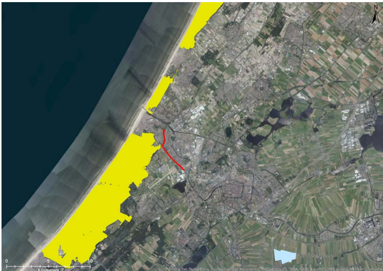
Figuur 5-1. Ligging van Natura 2000-gebieden ten opzichte van het plangebied. Bovenste gele gebied: Kennemerland-Zuid; middelste gele gebied: Coepelduynen; onderste gele gebied: Meijendel & Berkheide; blauwe gebied: De Wilck; rode lijn: plangebied.

Het plangebied maakt geen deel uit van een Natura 2000-gebied (Figuur 5-1). In de directe omgeving komen echter wel Natura 2000-gebieden. Natura 2000-gebieden die voorkomen in de omgeving van het plangebied en gevoelig zijn voor stikstofdepositie zijn Meijendel & Berkheide (100 m van plangebied), Coepelduynen (2,7 km van plangebied) en Kennemerland-Zuid (10 km van plangebied). Op dit moment worden de berekeningen hiervoor uitgevoerd. Daarnaast komt op 13 km afstand van het plangebied Natura 2000-gebied De Wilck voor. Dit gebied is niet gevoelig voor stikstofdepositie.