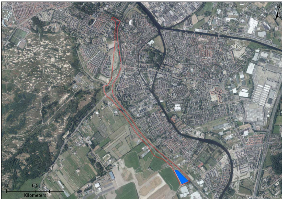
Figuur 4-4. Weergave van mogelijke geschikt habitat voor rugstreeppadden (in het blauw) binnen het plangebied (rood omlind).