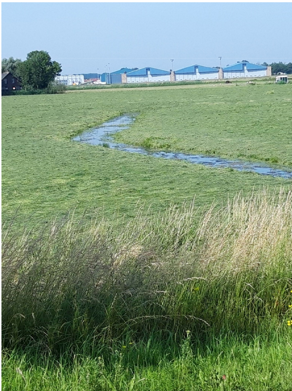
Figuur 4-6. Sloot aan de Kooltuinweg met mogelijk geschikt habitat voor rugstreeppadden.

Conclusie: In het plangebied komen mogelijk rugstreeppadden voor. Een overtreding van verbodsbepalingen ten aanzien van amfibieën kan daarom niet op voorhand worden uitgesloten.