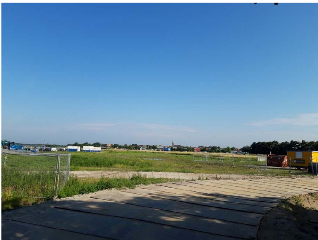
Figuur 4-5. Bouwterrein ter hoogte van de achterweg met mogelijk geschikt habitat voor rugstreeppad.