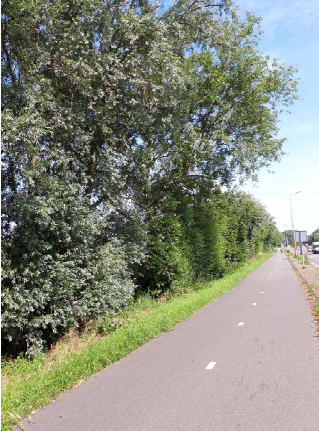
Figuur 4-1. Bomenrij langs de N206 ter hoogte van de Zanderij

de Zeeweg zijn holtes waargenomen die mogelijk geschikt zijn voor vleermuizen. Deze bomen zullen in het voornemen blijven staan.