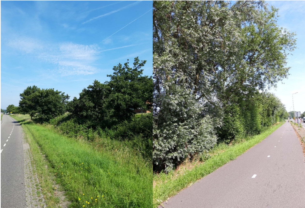
Figuur 3-6. Foto gemaakt aan de Kooltuinweg.