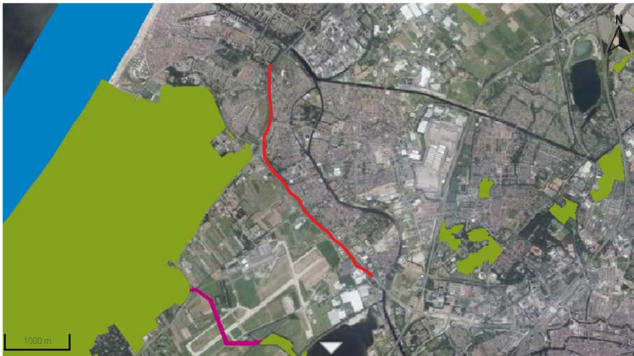
Figuur 5-2. Ligging van het plangebied ten opzichte van het NNN. Rode lijn: plangebied, overige kleuren: NNN.