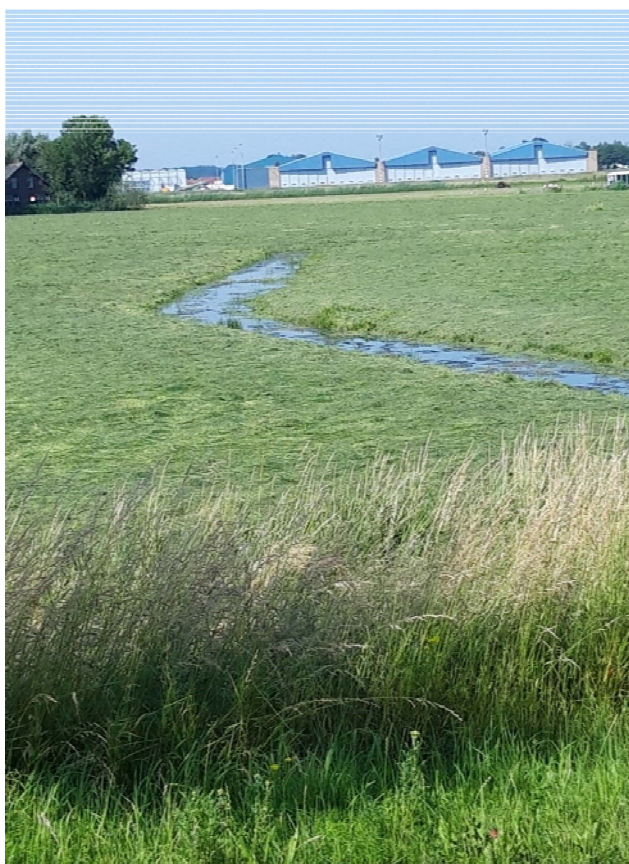
Figuur 3-4. Foto gemaakt aan de Kooltuinweg.