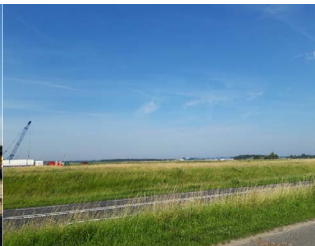
Figuur 3-3. Foto gemaakt aan de achterweg.