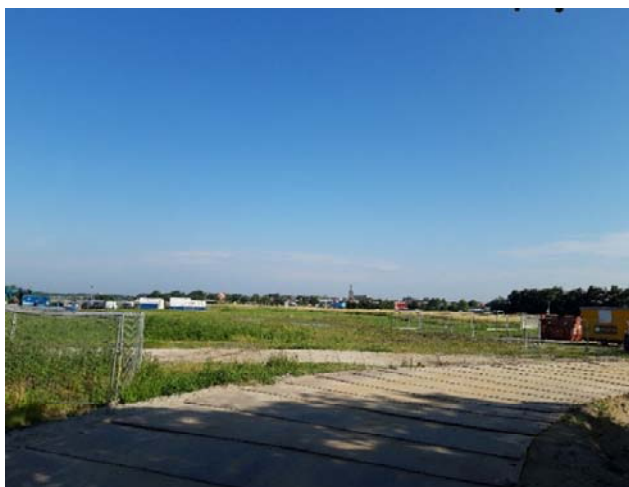
Figuur 3-2. Foto gemaakt aan de achterweg.