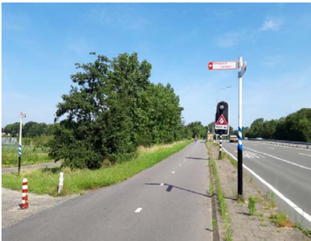
Figuur 3-8. Foto gemaakt ter hoogte van de Zanderij.