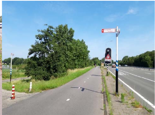
Figuur 4-2. Bomenrij langs de N206 ter hoogte van de Zanderij.