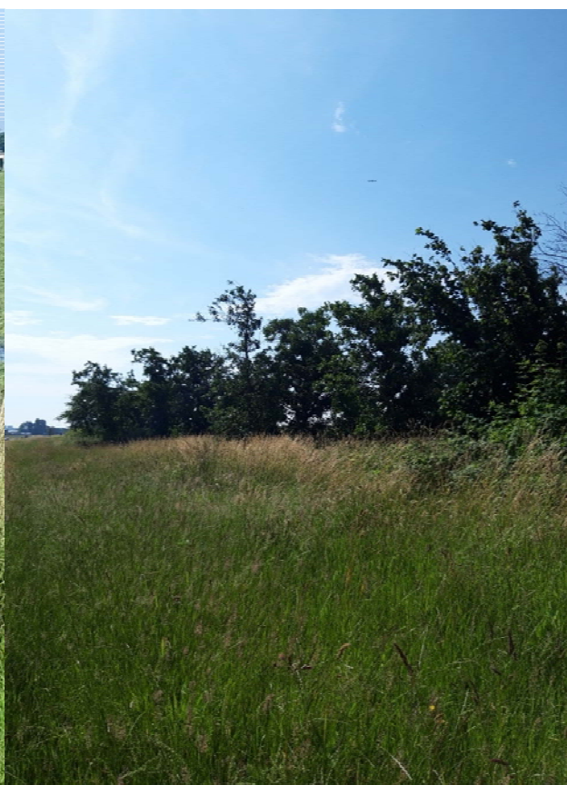
Figuur 3-5. Foto gemaakt onder Achterweg viaduct.