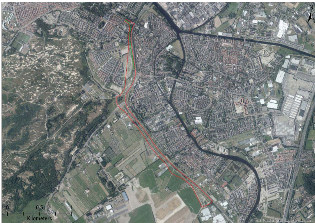
Figuur 4-3. Locatie van potentiële vliegroute (groene lijn) ten opzichte van het plangebied (rode lijn).

Conclusie: Binnen het onderzoeksgebied zijn waarnemingen bekend van meerdere soorten vleermuizen. Het overtreden van verbodsbepalingen uit de Wnb ten aanzien van vleermuizen kan daarom niet op voorhand worden uitgesloten.