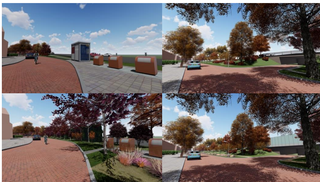
Afbeelding 4: een impressie van de huidige (boven) en de nieuwe (onder) situatie van de Baron van Wassenaarlaan t.h.v. de Commandeurslaan