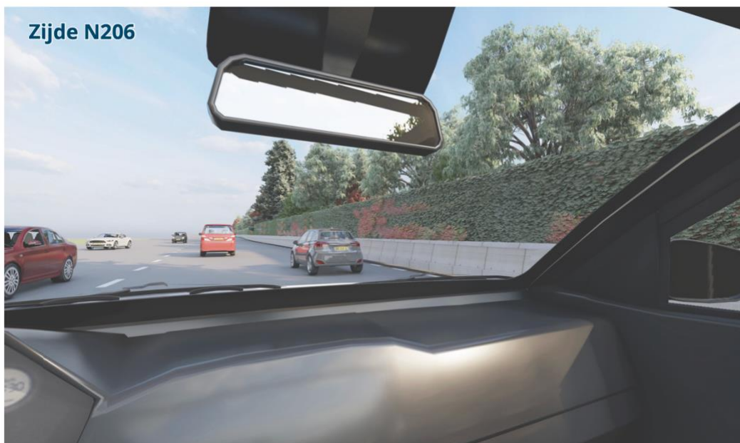
Afbeelding 3: een impressie van het geluidsscherm vanaf de N206