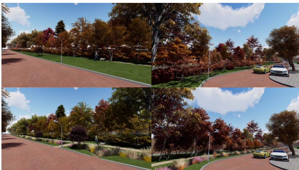
Afbeelding 5: een impressie van de huidige (boven) en de nieuwe (onder) situatie van de Baron van Wassenaarlaan.