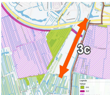
Figuur 2 In groene gebied doen bedrijven legselbeheer