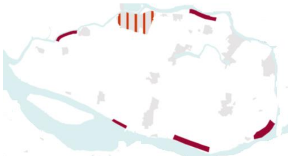
Figuur 2: Locaties windenergie, VRM 2014.

De beoogde locatie ligt in de westrand van de Hoeksche Waard. Voor dit gebied zijn op verschillende bestuurlijke niveaus ruimtelijke visies en/of visies met betrekking tot wind vastgesteld. De in de VRM opgenomen locaties windenergie in de Hoeksche Waard zijn het resultaat van een afweging tussen eisen vanuit windenergie en de randvoorwaarden vanuit landschap en ruimtelijke kwaliteit. Hieruit vloeit voort dat voor heel Zuid-Holland de voorkeur uitgaat naar lijnopstellingen ten opzichte van clusteropstellingen en dat deze lijnopstellingen gekoppeld zijn aan infrastructuur en/of waterwegen. Vanuit deze uitgangspunten zijn in Hoeksche Waard alleen locaties aangewezen langs de rand van het gebied (zie figuur 2).